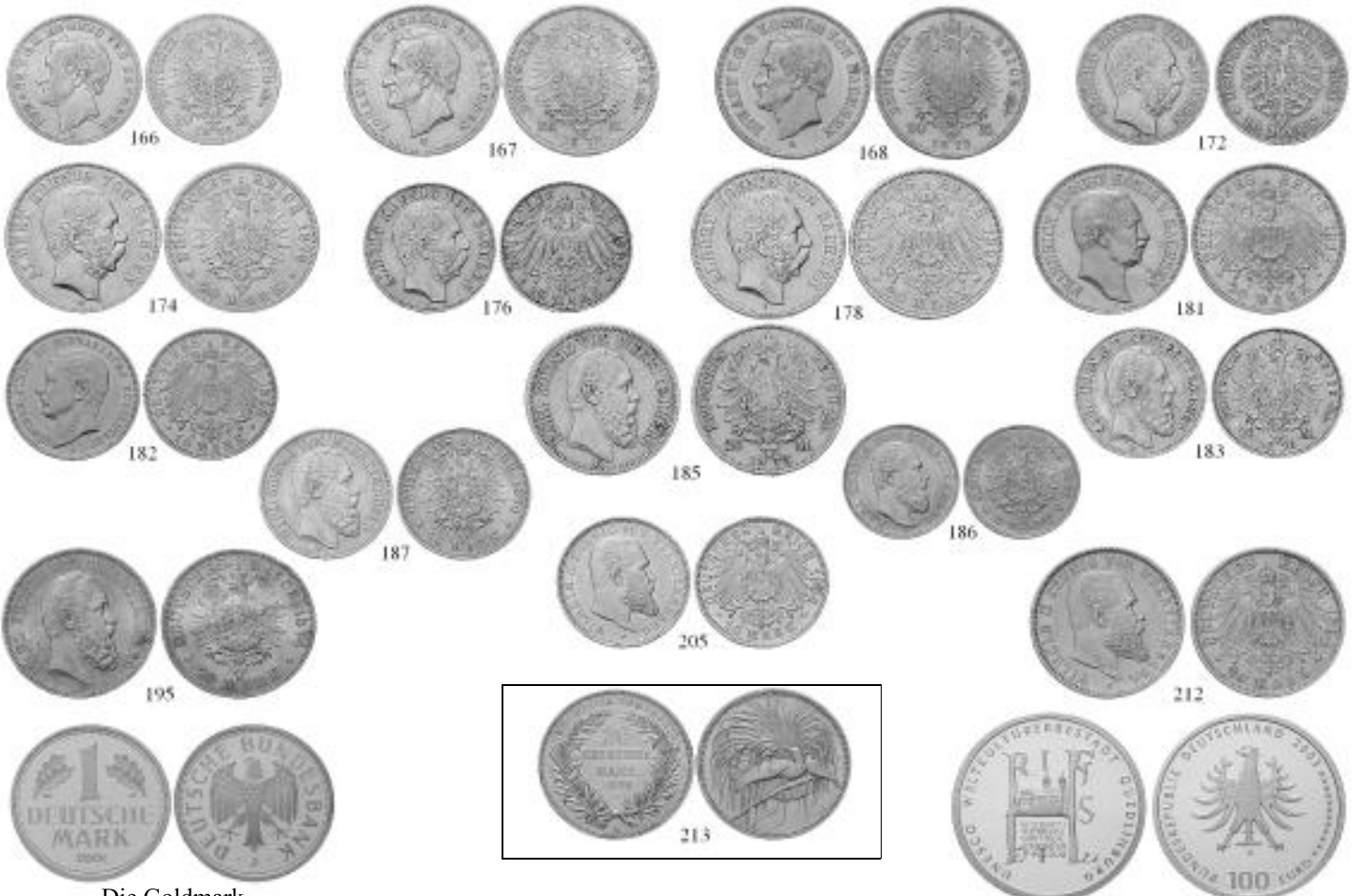
Die Goldmark Best.-Nrn.: 214 und 215