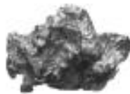
253 Abb. vergrößert