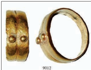
9012 Fingerring 2.-4. Jh.n.Chr. Aus zwei glatten Reifen zusammengesetzter Fingerring, jeder Einzelreif mit einer Goldperle verziert. Durchm. 1,45 cm, 2,57g. Intakt. Gold. 250,-