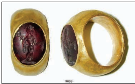
9009 Fingerring 2.-4. Jh. n.Chr. Breiter, hohl gearbeiteter Goldring. Der als Schmuck eingesetzte geschnittene Karneol (15 x 11,5 mm) zeigt einen Merkur mit Petasos, Caduceus und Geldbeutel. Durchm. 1,75 cm, 7,93 g. Qualitätsvolle Arbeit. Intakt. Gold. 1.500,-