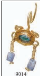
9014 Ohringe Spätromisch. Einzelohrring. Dünne Goldplatte, oben verziert mit zwei Voluten, darin eingefast ein hellgrüner Glasstein, unten mit zwei kleinen Anhängern verziert mit je einem hellblauen Glasstein. Gesamtlänge 2,8 cm. Intakt. Gold. 450,-