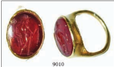
9010 Fingerring 2.-4. Jh.n.Chr. Dünner Goldreif. In die ovale Goldplatte eingelassen ein geschnittener Karneol (10 x 14,5 mm), er zeigt Merkur mit Geldbeutel. Durchm. 1,3 cm, 2,54 g. Intakt. Gold. 750,-