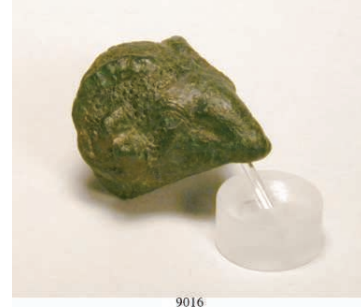
ROM, BRONZEAPPLIKEN 9016 ca. 1.Jh. n. Chr. Widderkopffapplike. L.ca 4 cm. Bronzehohlguß. Detaillierter Widderkopf mit schöner grüner Patina. Intakt. 250,-