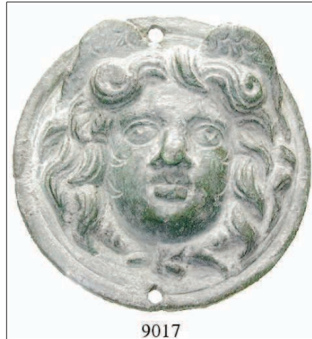
9017 2.-3.Jh. n. Chr. Bronzeapplike mit dem Kopf der Gorgo. Typisch dargestellt sind die wallenden, unter dem Kinn zusammengebundenen Haare und die aus dem Kopf ragenden Flügel. Fast vorzüglich erhalten mit gleichmäßiger hellgrüner Patina. Zwei Befestigungslöcher. Durchmesser 6,3 cm. 1.550,-