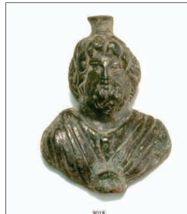
9018 2.-3.Jh. n. Chr. Büste des bärtigen Serapis. Als Kopfbedeckung trägt er den Polos, der Oberkörper ist drapiert. Bronze, H. 7 cm. Gleichmäßige dunkelgrüne Patina, auf der Rückseite eine Befestigungsmöglichkeit. Sehr schön erhalten, intakt. 650,-