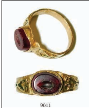
9011 Fingerring 2.-4. Jh.n.Chr. Glatter, an den Schultern verzierter Reif. In die Bodenplatte eingelassen ein roter Karneol (8,5 x 6,5 mm) mit Darstellung eines Fisches. Durchm. 1,5 cm, 2,30 g. Intakt. Gold. 395,-