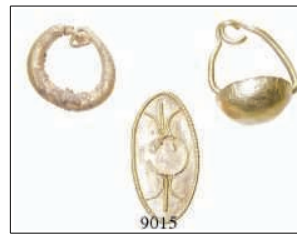
9015 Lot 2.-4. Jh. n.Chr. Drei verschiedene Objekte. Einzelohrring mit hohler Halbkugel (1,6cm); kleiner Hohlreif (Ohring?) 1,3 cm; ovale Platte eines Ringes, der Schmuckstein fehlt (1,8 x 0,9 cm). Gesamt 1,9 g. Gold. 145,-