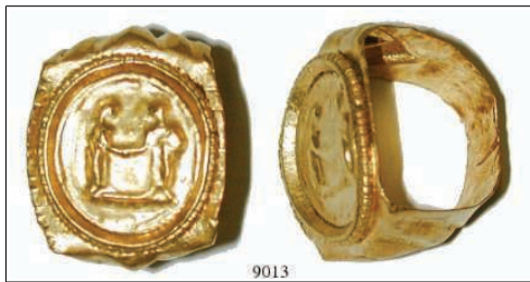
9013 Fingerring. Der Ring aus einem Goldblech gearbeitet, an den Schultern durch Treibarbeiten verziert. Oben aufgesetzt ist eine dünne Goldplatte (13,5 x 15 mm), durch einen gebördelten Ring gefasst. Sie zeigt ein Paar, das sich die Hand reicht. Durchmesser des Rings 1,55 cm. Intakt. Gold. 1.200,-