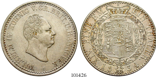
Best.-Nr. 101426 BRAUNSCHWEIG, KÖNIGREICH HANNOVER Wilhelm IV., 1830-1837 Taler 1834, B. AKS 62; Th. 152; J. 49; Kahnt 219. geputzt, ss-vz