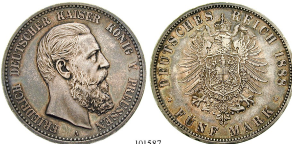
PREUSSEN Best.-Nr. 101587 Friedrich III., 1888 5 Mark 1888, A. J. 99. l. geputzt, f.vz