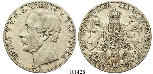
Best.-Nr. 101428 Vereinstaler 1866, B. AKS 144; Th. 174; J. 96; Kahnt 239. ss