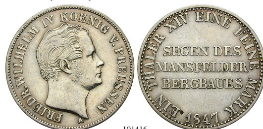
Best.-Nr. 101416 Ausbeutetaler 1847, A. AKS 75; Th. 257; Kahnt 376. geputzt, ss+ 80,-