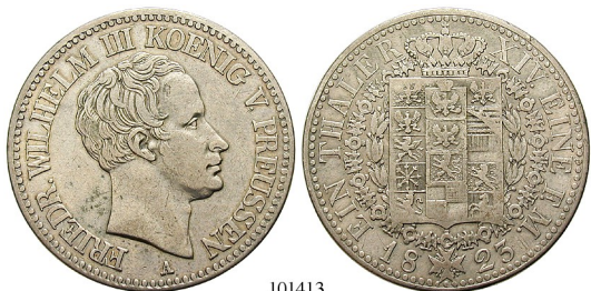
Best.-Nr. 101413 Taler 1823, A. AKS 14; Th. 247; J. 59; Kahnt 367. ss+ 100,-