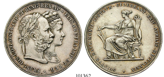
Best.-Nr. 101362 Doppelgulden 1879. Auf die Silberhochzeit. Herinek 824; Th. 464. geputzt, ss-vz 210,-