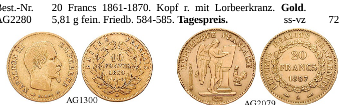
Best.-Nr. AG1300 III. Republik, 1871-1940 20 Francs 1871-1898. Genius. Gold. 5,81 g fein. Friedb. 592. Tagespreis. ss 375,-