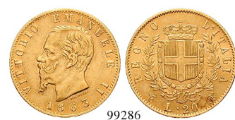
Best.-Nr. 99286 Vittorio Emanuele II., 1861-1878 20 Lire 1863, T Turin. Gold. 5,81 g fein. Friedb. 11. Tagespreis. Rdf. auf Vs., f.vz/vz-st 720,-