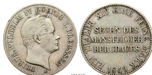
Best.-Nr. 101418 Ausbeutetaler 1849, A. AKS 75; Th. 257; Kahnt 376. Rdf., ss 80,-