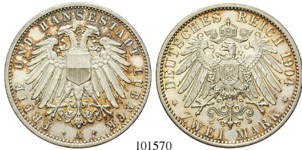
LÜBECK Best.-Nr. 101570 2 Mark 1904, A. J. 81. min. geputzt, vz+