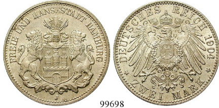
HAMBURG Best.-Nr. 99698 2 Mark 1904, J. J. 63. PCGS MS66. vz-st