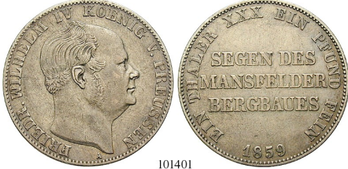
Best.-Nr. 101401 Ausbeutevereinstaler 1859, A. AKS 79; Th. 263; J. 85; Kahnt 380. ss 80,-