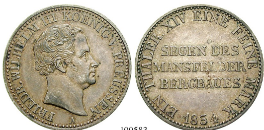
Best.-Nr. 100583 Ausbeutetaler 1834, A. AKS 18; Th. 251; J. 63. ss-vz 125,-