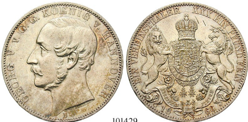
Best.-Nr. 101429 Georg V., 1851-1866 Vereinstaler 1866, B. AKS 144; Th. 174; J. 96; Kahnt 239. berieben, ss-vz