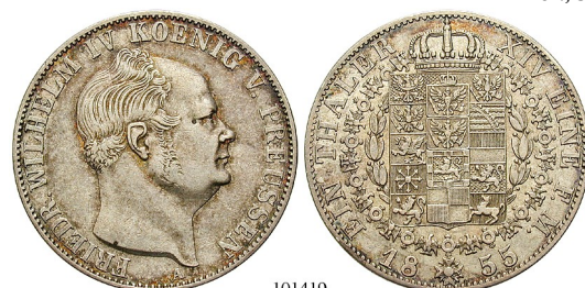
Best.-Nr. 101419 Taler 1855, A. AKS 76; Th. 260; J. 80; Kahnt 377. ss+/ss-vz 100,-