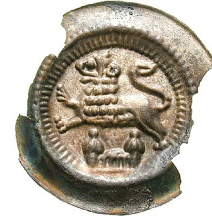
Best.-Nr. 101138 BRAUNSCHWEIG, BRAUNSCHWEIG-LÜNEBURG Heinrich der Lange, 1195-1227 Brakteat. 0,49 g. Löwe l., darunter zwei Kuppeltürme. Berger var. 679. Randausbrüche, vz 300,-