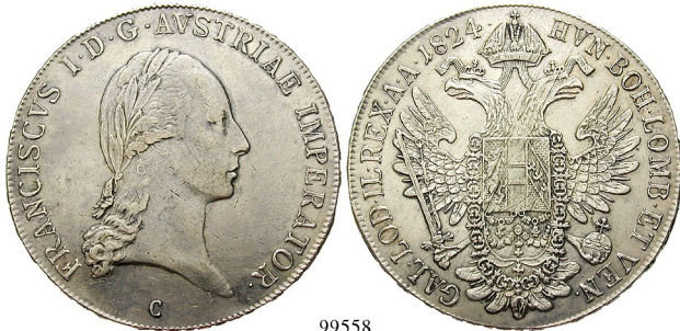
Best.-Nr. 99558 Konventionstaler 1824, C Prag. 28,05 g. Herinek 322; JI. 247. Rs. justiert, ss+ 120,-