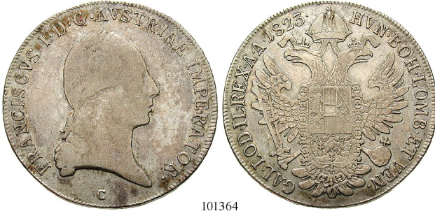
Best.-Nr. 101364 Konventionstaler 1823, C Prag. 27,75 g. Herinek 322; JI. 247. ss 100,-