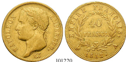
Best.-Nr. 101220 Napoleon I. (Kaiser), 1804-1815 40 Francs 1812, A. Kopf mit Lorbeerkrantz. Gold. 11,61 g fein. Friedb. 505; Gad. 1084. Tagespreis. ss-vz 1.500,-