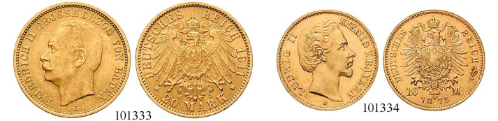
Best.-Nr. 101333 Friedrich II., 1907-1918 20 Mark 1911, G. Gold. J. 192. Tagespreis. Kratzer auf Vs., f.vz/vz+