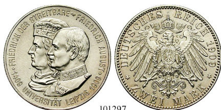
SACHSEN Best.-Nr. 101297 Friedrich August III., 1904-1918 2 Mark 1909. Universität Leipzig. J. 138. f.st