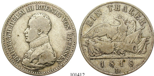
Best.-Nr. 101412 Taler 1818, D. AKS 13; Th. 246D; J. 37; Kahnt 365. ss 80,-