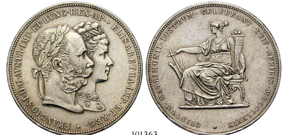
Best.-Nr. 101363 Doppelgulden 1879. Auf die Silberhochzeit. Herinek 824; Th. 464. berieben; Kratzer und Rdf., ss+ 190,-