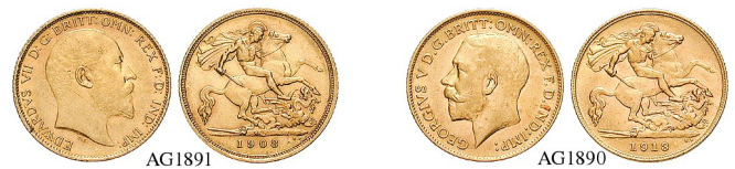
Best.-Nr. AG1891 Edward VII., 1901-1910 Half-Sovereign 1902-1910. Gold. 3,66 g fein. Friedb. 401. Tagespreis. ss 455,-