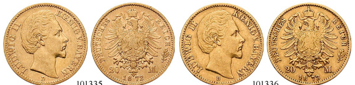
Best.-Nr. 101335 20 Mark 1872, D. Gold. J. 194. Tagespreis. ss+ Best.-Nr. 101336 20 Mark 1873, D. Gold. J. 194. Tagespreis. ss+