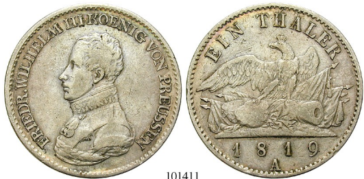
Best.-Nr. 101411 Taler 1819, A. AKS 13; Th. 246; J. 37; Kahnt 365. ss 85,-