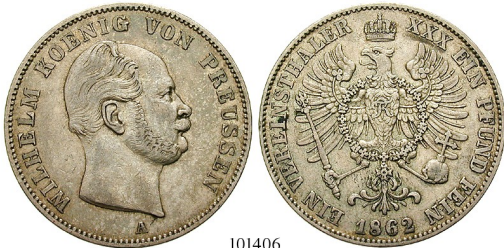
Best.-Nr. 101406 Wilhelm I., 1861-1888 Vereinstaler 1862, A. AKS 97; Th. 266; J. 92. ss+ 75,-