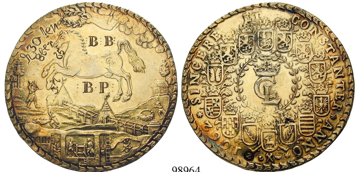
Best.-Nr. 98964 BRAUNSCHWEIG, BRAUNSCHWEIG-LÜNEBURG-CELLE Christian Ludwig, 1648-1665 Löser zu 2 Reichstalem 1662, Clausthal. 58,11 g. Ausbeute der Harzer Gruben. Mit Wertpunze. Niedersachsenroß über Bergwerksdarstellung l., wird von einer Hand aus Wolken bekrönt / Gekröntes Monogramm im Lorbeerkrantz, umgeben von 14 gekrönten Wappen auf Rankenornamenten. Dav. 174; Welter 1497; Müseler 10.4.1/52; Duve 9b. Alt vergoldet, neuzeitl. Gravuren und Sammlerzeichen, ss 1.200,-