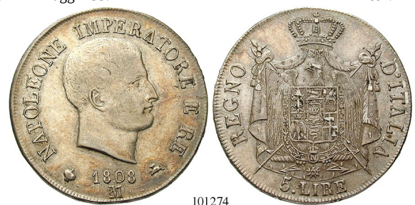
Best.-Nr. 101274 ITALIEN, KÖNIGREICH Napoleon I., 1805-1814 5 Lire 1808, M Mailand. Dav. 202. ss+/ss-vz 140,-