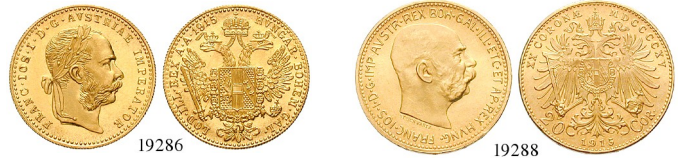
Best.-Nr. 19286 Dukaten 1915. Neuprägung. Gold. 3,44 g fein. Tagespreis. st 435,- Best.-Nr. 19288 20 Kronen 1915. Neuprägung. Gold. 6,09 g fein. Tagespreis. st 730,-