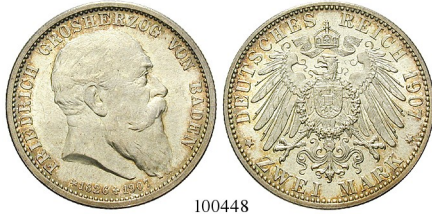
Best.-Nr. 100448 2 Mark 1907, G. Auf den Tod. J. 36. NGC MS65. vz-st