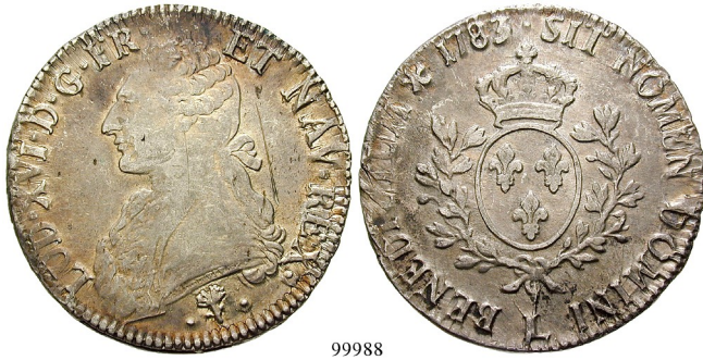
Best.-Nr. 99988 Louis XVI., 1774-1793 Ecu aux branches d'olivier 1783, L Bayonne. 29,31 g. Dav. 1334; Gad. 356. Kratzer auf Vs., ss 100,-