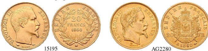
Best.-Nr. 15195 Napoleon III., 1852-1860. Barhäuptiger Kopf. Gold. 5,81 g fein. Friedb. 573, 574. Tagespreis. ss 725,-