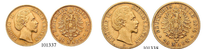
Best.-Nr. 101337 10 Mark 1875, D. Gold. J. 196. Tagespreis. ss-vz Best.-Nr. 101338 20 Mark 1874, D. Gold. J. 197. Tagespreis. ss+