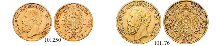
Best.-Nr. 101250 5 Mark 1877, G. Gold. J. 185. Tagespreis. ss Best.-Nr. 101176 10 Mark 1900, G. Gold. J. 186. Tagespreis. kl. Rdf., konkaver Schrötling, ss