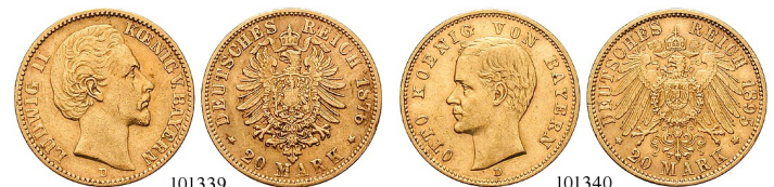
Best.-Nr. 101339 20 Mark 1876, D. Gold. J. 197. Tagespreis. ss+ Best.-Nr. 101340 Otto, 1886-1913 20 Mark 1895, D. Gold. J. 200. Tagespreis. ss-vz/vz