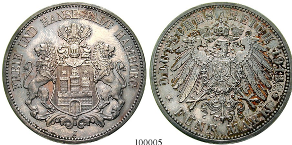
Best.-Nr. 100005 5 Mark 1913, J. J. 65. NGC PF62. l. berührt, PP