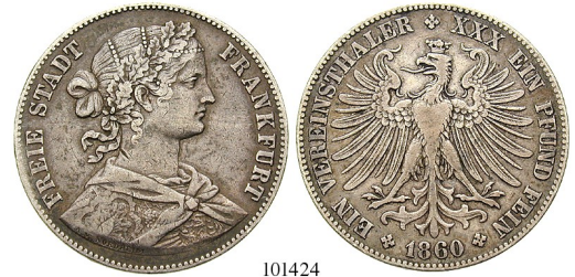
Best.-Nr. 101424 Vereinstaler 1860. Francofurtia. AKS 10; Th. 144; J. 42b; Kahnt 170. ss