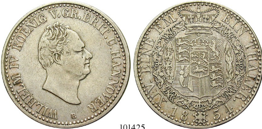
Best.-Nr. 101425 Taler 1834, B. AKS 62; Th. 152; J. 49; Kahnt 219. ss