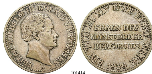
Best.-Nr. 101414 Ausbeutetaler 1836, A. AKS 18; Th. 251; J. 63. Rdf., ss+ 80,-