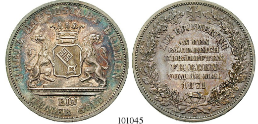
Best.-Nr. 101045 BREMEN, STADT Taler Gold 1871. Siegestaler. AKS 17; Th. 127; J. 28; Kahnt 164. l. berieben; kl. Rdf., ss-vz