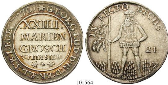
Best.-Nr. 101564 Georg I. Ludwig, 1698-1727 24 Mariengroschen 1701, Zellerfeld. 12,90 g. Wilder Mann. Dav. 423; Welter 2158.ss