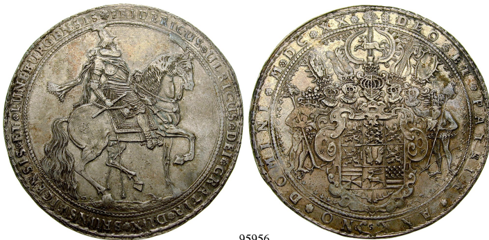
Best.-Nr. 95956 Friedrich Ulrich, 1613-1634 Löser zu 5 Reichstalem 1620, Zellerfeld. 143,02 g. Mit Wertpunze. Geharnischter Herzog mit Federhut und Kommandostab zu Pferd / Fünffach behelmtes Wappen. Dav. 45; Welter 1015; Duve 6. kl. Graffito im Feld der Vs., ss-vz 10.750,-