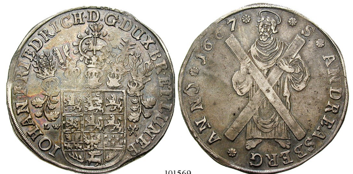
Best.-Nr. 101569 BRAUNSCHWEIG, BRAUNSCHWEIG-CALENBERG-HANNOVER Johann Friedrich, 1665-1679 Reichstaler 1667, Clausthal. 28,58 g. Ausbeute St. Andreasberg. Dav. 6557; Welter 1708; Müseler. Zainende, ss 800,-