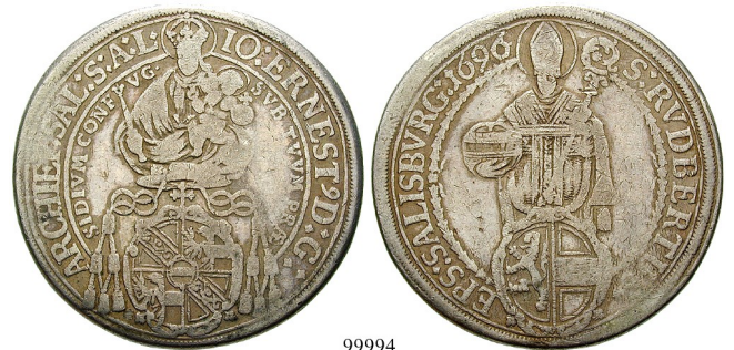
Best.-Nr. 99994 SALZBURG, BISTUM Johann Ernst von Thun und Hohenstein, 1687-1709 Reichstaler 1696. 28,03 g. Dav. 3510; Probszt 1802. f.ss 160,-