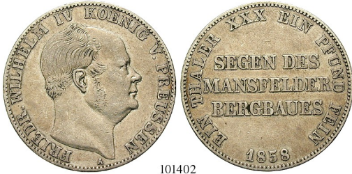
Best.-Nr. 101402 Ausbeutevereinstaler 1858, A. AKS 79; Th. 263; J. 85; Kahnt 380. ss 80,-