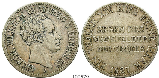
Best.-Nr. 100579 Ausbeutetaler 1827, A. AKS 16; Th. 248; J. 61. ss 85,-