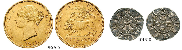
Best.-Nr. 96766 INDIEN, OSTINDISCHE KOMPANIE Victoria, 1837-1901 Mohur 1841, Kalkutta. Type B/I, Cosslet 4. Young head. Gold. 10,72 g fein. Friedb. 1595a; S & W 3.11; Prid. 22; KM 462.2. Prachtexemplar einer seltenen Variante in herausragender Erhaltung. NGC MS63. vz-st 31.000,-