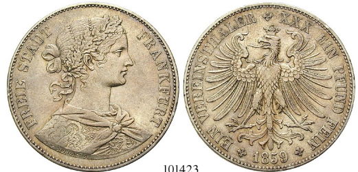
Best.-Nr. 101423 Vereinstaler 1859. Francofurtia. AKS 8; Th. 142; J. 41; Kahnt 168. ss