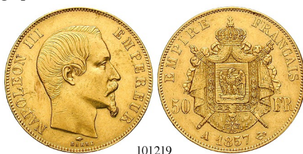
Best.-Nr. 101219 Napoleon III., 1852-1870 50 Francs 1857, A. Barhäuptiger Kopf. Gold. 14,52 g fein. Friedb. 571; Gad. 1111. Tagespreis. Rdf. auf Rs., ss-vz 1.880,-