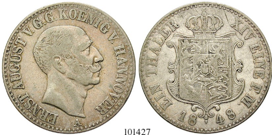
Best.-Nr. 101427 Ernst August, 1837-1851 Taler 1848, A. AKS 105; Th. 166; J. 71. ss