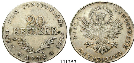
Best.-Nr. 101357 20 Kreuzer 1809, Hall. Aufstand unter Andreas Hofer. JI. 169; Herinek 824. ss+ 110,-