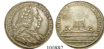
Best.-Nr. 100882 Silberabschlag 1742. Von den Stempeln des Dukaten. Auf seine Wahl zum Kaiser. JuF 743; Förschner 249. Kratzer auf Vs., ss-vz