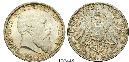
Best.-Nr. 100449 BADEN Friedrich I., 1852-1907 2 Mark 1907, G. Auf den Tod. J. 36. NGC MS65. vz-st 175,-