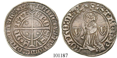
Best.-Nr. 101187 FRANKREICH, METZ, STADT Groschen 1406-1500. 2,70 g. Langkreuz und Sterne im doppelten Schriftkreis / Der Heilige Stephan kniet zwischen zwei Schilden. Cahn 359; Boudeau 1659. ss+ 160,-