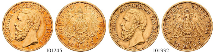
Best.-Nr. 101245 20 Mark 1894, G. Gold. J. 189. Tagespreis. kl. Rdf., ss-vz Best.-Nr. 101332 20 Mark 1894, G. Gold. J. 189. Tagespreis. ss+