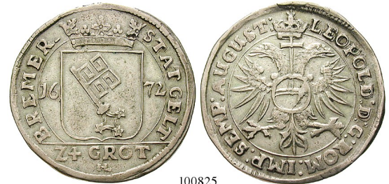
Best.-Nr. 100825 24 Grote 1672. 11,26 g. Mit Titel Leopold I. Jungk 595. ss-vz