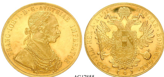
Best.-Nr. AG17855 Franz Joseph I., 1848-1916 4 Dukaten 1915. Neuprägung. Gold. 13,77 g fein. Tagespreis. bfr. 1.650,-