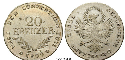
Best.-Nr. 101355 20 Kreuzer 1809, Hall. Aufstand unter Andreas Hofer. JI. 169; Herinek 824. geputzt, ss+ 100,-