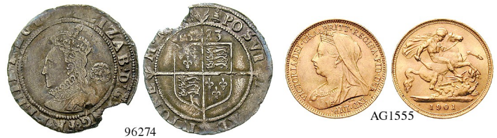
Best.-Nr. 96274 GROSSBRITANNIEN Elizabeth I., 1558-1603 Sixpence 1583. 2,4 g. Sixth Issue, mm. Bell. S. 2578A. Randausbruch, ss+ 150,-