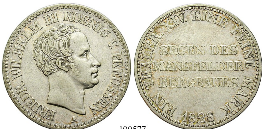
Best.-Nr. 100577 Ausbeutetaler 1828, A. AKS 16; Th. 248; J. 61. ss+ 90,-