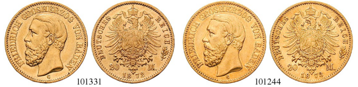
BADEN Best.-Nr. 101331 Friedrich I., 1852-1907 20 Mark 1872, G. Gold. J. 184. kl. Kratzer und Rdf., f.vz Best.-Nr. 101244 20 Mark 1873, G. Gold. J. 184. Tagespreis. Kratzer auf Vs., ss-vz