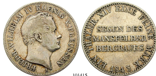
Best.-Nr. 101415 Friedrich Wilhelm IV., 1840-1861 Ausbeutetaler 1843, A. AKS 75; Th. 257; Kahnt 376. ss 80,-