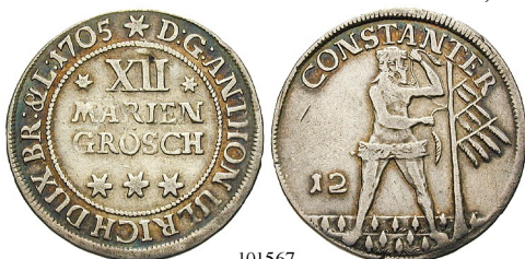
Best.-Nr. 101567 Anton Ulrich, 1704-1714 12 Mariengroschen 1705, Zellerfeld. Welter 2314. ss 80,-