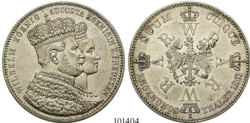
Best.-Nr. 101404 Krönungstaler 1861, A. AKS 116; Th. 265; J. 87. f.vz 60,-