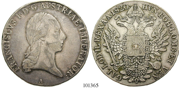
Best.-Nr. 101365 Konventionstaler 1820, A. 27,83 g. Herinek 305; JI. 190. ss+ 130,-