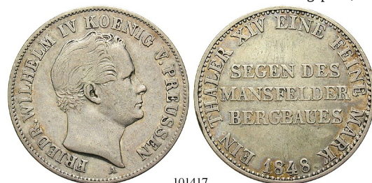
Best.-Nr. 101417 Ausbeutetaler 1848, A. AKS 75; Th. 257; Kahnt 376. ss 80,-