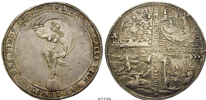
Best.-Nr. 92239 BRAUNSCHWEIG, BRAUNSCHWEIG-WOLFENBÜTTEL 2.400,- 92239 Friedrich Ulrich, 1613-1634 Löser zu 1/4 Reichstaler o.J. (1622), Andreasberg. 35,96 g. Ausbeuteprägung, sog. "Glückslöser". Fortuna auf Globus, mit einfach geschwungenem Segel am Mastbaum / Kreuz mit Inschriften trennt vier Bilder (Jagd, Fischerei, Ackerbau, Bergbau). Dav. 6311; Welter 1049; Duve 11 II; Müseler 10.2/48 b. ss-vz/ss