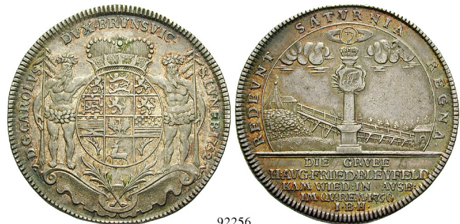
Best.-Nr. 92256 Reichstaler 1752, Zellerfeld IBH. 2.350,- 92256 29 g. Ausbeute der Grube Herzog Friedrich August Bleyfeld. Dav. 2167; Welter 2725; Müseler 10.3/57. f.vz