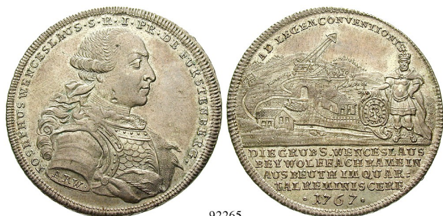
Best.-Nr. 92265 FÜRSTENBERG, GRAFSCHAFT 6.900,- 92265 Joseph Wenzel, 1762-1783 Konventionstaler 1767, Stuttgart. 28,1 g. Ausbeute Grube St. Wenzel bei Wolfach. Dav. 2270; Dollinger 33; Müseler 19/11. Nur 500 Ex. geprägt. Schrf. und Kratzer auf Vs., vz/vz-st