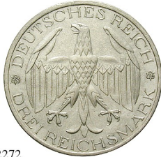
Best.-Nr. 102272 3 Reichsmark 1929, A. Waldeck. J. 337. geputzt, ss-vz 115,-