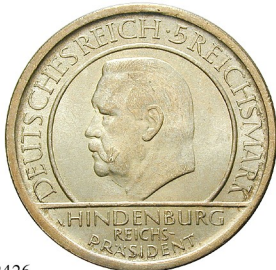
Best.-Nr. 102426 5 Reichsmark 1929, F. Verfassung. J. 341. kl. Kratzer, vz 135,-