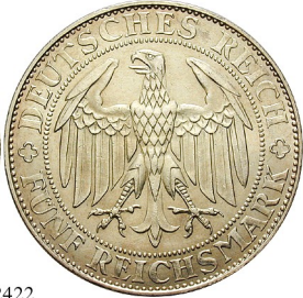
Best.-Nr. 102422 5 Reichsmark 1929, E. Meißen. J. 339. Kratzer auf Vs., ss-vz/vz 340,-