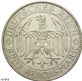
Best.-Nr. 102277 5 Reichsmark 1929, E. Meißen. J. 339. geputzt, ss 270,-