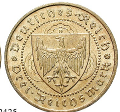
Best.-Nr. 102425 3 Reichsmark 1930, D. Vogelweide. J. 344. Rdf., vz 100,-