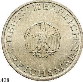
Best.-Nr. 102428 5 Reichsmark 1929, A. Lessing. J. 336. Kratzer auf Vs., ss-vz/vz 130,-