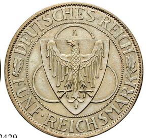
Best.-Nr. 102429 5 Reichsmark 1930, A. Rheinlänrdäumung. J. 346. stark berieben, ss+ 140,-