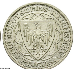
Best.-Nr. 102273 3 Reichsmark 1931, A. Magdeburg. J. 347. Vs. geputzt, ss-vz/vz 220,-