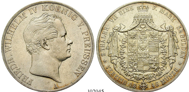
Best.-Nr. 102045 Friedrich Wilhelm IV., 1840-1861 Vereinsdoppeltaler 270,- 102045 1846, A. 37,11 g. AKS 69; Th. 258; J. 74. kl. Kratzer, ss-vz