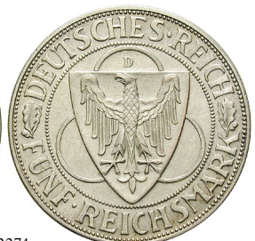
Best.-Nr. 102274 5 Reichsmark 1930, D. Rheinlänrdäumung. J. 346. f.vz 170,-