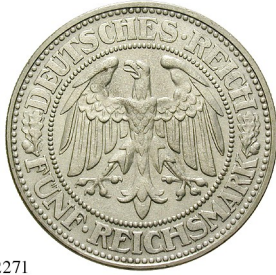
Best.-Nr. 102271 5 Reichsmark 1927, D. Eichbaum. J. 331. geputzt, ss-vz 160,-