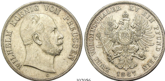
Best.-Nr. 102056 Wilhelm I., 1861-1888 Vereinsdoppeltaler 1867, C. 750,- 102056 37,09 g. AKS 96; J. 97; Th. 269 C; Kahnt 392. geputzt, kl. Kratzer, ss-vz