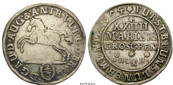
Best.-Nr. 102441 Rudolf August und Anton Ulrich, 1685-1704 24 100,- 102441 Mariengroschen 1694, Braunschweig HCH. Roß. Dav. 332; Welter 2082. ss