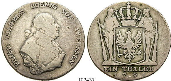
Best.-Nr. 102437 Friedrich Wilhelm II., 1786-1797 Taler 1791, Berlin A. 140,- 102437 21,77 g. Dav. 2599; v.Schr. 35; J. 25. ss