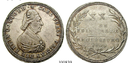
Best.-Nr. 100839 FÜRSTPRIMATISCHE STAATEN 400,- 100839 Carl Theodor von Dalberg, 1806-1810 1/2 Konventionstaler 1809, Regensburg. 14,04 g. Für die Exklave Regensburg. AKS 8; J. 5. NGC AU58. feiner Schrötlingriss; Prägeschwäche auf Rs., vz