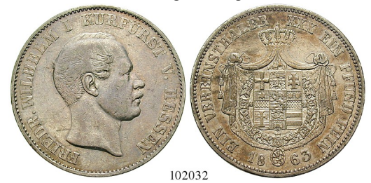
Best.-Nr. 102032 HESSEN, HESSEN-KASSEL 160,- 102032 Friedrich Wilhelm I., 1847-1866 Vereinstaler 1863. 18,49 g. ohne Signatur CP. AKS 63; Th. 190; J. 48b. kl. Kratzer und Rdf., ss