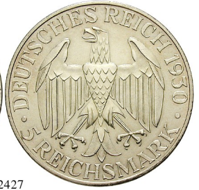
Best.-Nr. 102427 5 Reichsmark 1930, A. Zeppelin. J. 343. l. berieben; kl. Rdf., vz 190,-