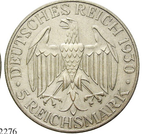
Best.-Nr. 102276 5 Reichsmark 1930, A. Zeppelin. J. 343. geputzt, ss-vz 180,-